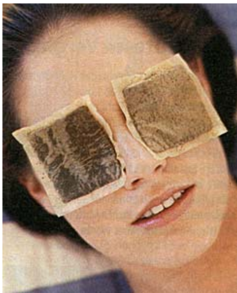
охлаждающие компрессы помогут избавиться от отеков

Опухшие глаза – а точнее, чаще всего опухают лишь нижние веки – появляются тогда, когда в тканях скапливается избыток воды, которая в виде лимфатической жидкости не выводится оптимально из организма. Причиной могут стать, например, пара лишних бокалов вина, слишком соленая пища, хаотический режим сна и бодрствования. Как впрочем, и аллергическая реакция или другие заболевания. Если у вас довольно часто отекают веки, то стоит в любом случае обратиться к врачу, чтобы тот помог выяснить причины подобный проявлений. Но, как правило, опухшие веки явление безобидное, и все возвращается в норму в течение дня.